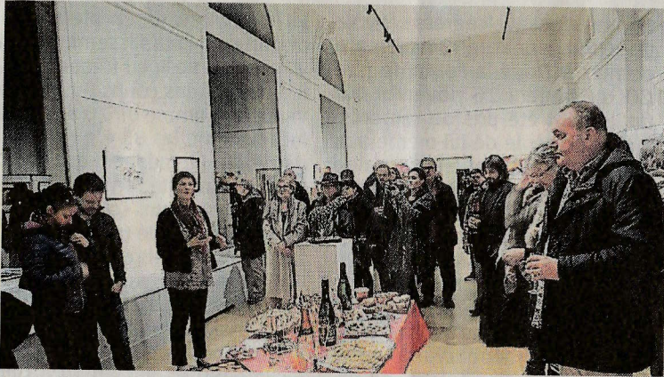
Le vernissage de l'exposition à la galerie Loire du Dôme.

Pendant trois jours, à la fin de mois de novembre, l'association Clip'art a permis à 19 artistes locaux d'exposer dans la galerie Loire du Dôme, en compagnie de deux invités de renom : Marie-Line Montécot, la grande dame de l'aquarelle, et Andrew Painter, un artiste qui allie le talent à l'humour et à la légèreté.